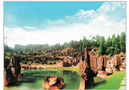
紅石林國家地質公園