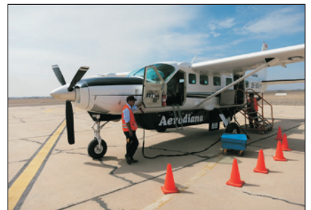
觀光小型飛機空中暢遊