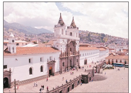
聖弗朗希斯科教堂