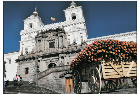
聖弗朗希斯科教堂