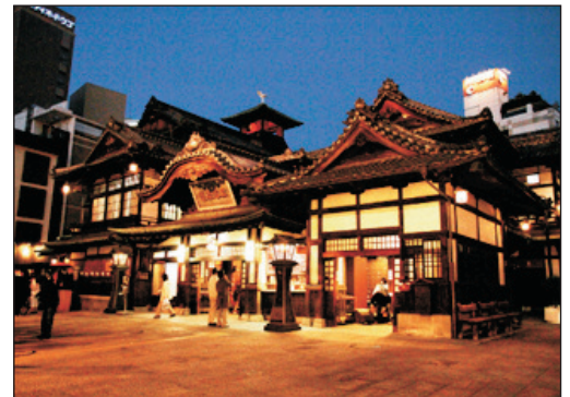
《千與千尋》藍本~ 道後溫泉