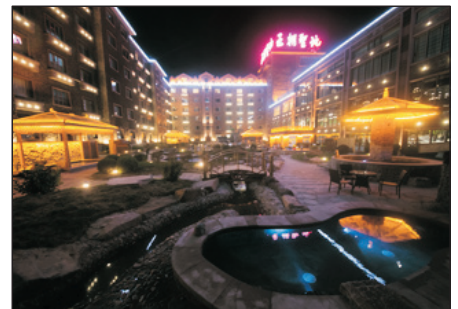
王朝聖地溫泉度假酒店