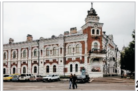
阿穆爾地方誌博物館