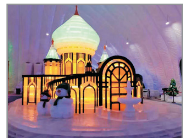
哈爾濱冰雪大世界

每位貴賓安排一部輕便導賞耳機， 隨時隨地清楚聆聽導遊講解， 輕鬆自在投入精彩旅程!(註5)