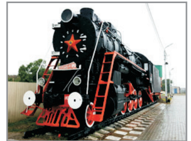
布拉戈維申斯克火車站