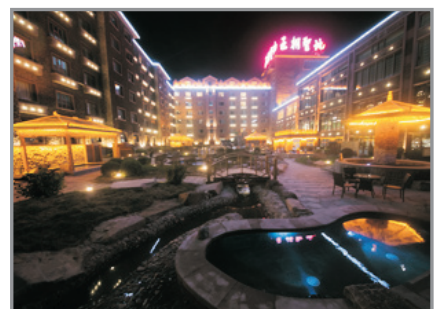
王朝聖地溫泉度假酒店