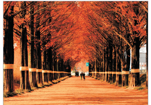
潭陽水杉林蔭大道

潭陽—水杉林蔭大道(包入場)—竹綠苑(包入場， 漫步竹林)—韓國第一楓葉山~內藏山國立公園 (賞紅葉，包入場)(註1)