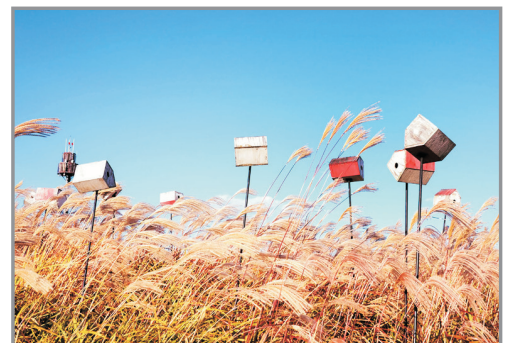
《增遊》漢江天空公園(賞紫芒草)(註1) (10月1日至31日出發團隊適用)