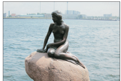
「童年回憶」 美人魚像

探訪聖誕老人村，一睹傳說中聖誕老人的真面目，村內所有建築物都是充滿童話色彩的歐陸式木屋。團友可在北極圈分界線拍照留念，更可獲得一張到達北極的證書。村內的聖誕老人郵局亦是必遊之處，除了有多項設計精美的聖誕郵票及精品外，團友更可自費填表，便可以在聖誕節收到聖誕老人寄來的賀節信件。