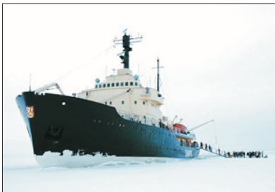
「難忘體驗」 破冰船之旅

乘坐觀光破冰船~SAMPO號，體驗難能可貴的極地探索之旅。親眼目睹壯麗無比的冰海奇景，親身體驗破冰船碾碎冰層的震撼感覺。重頭節目是穿上特製全身防水保暖橡皮衣，躺在飄著浮冰的冰海中，安全好玩，體驗畢生難忘的旅程。