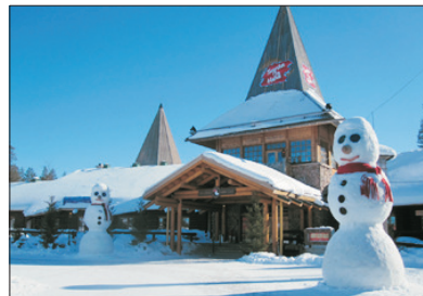
「親身到訪」 聖誕老人村

乘坐觀光破冰船~SAMPO號，體驗難能可貴的極地探索之旅。親眼目睹壯麗無比的冰海奇景，親身體驗破冰船碾碎冰層的震撼感覺。重頭節目是穿上特製全身防水保暖橡皮衣，躺在飄著浮冰的冰海中，安全好玩，體驗畢生難忘的旅程。