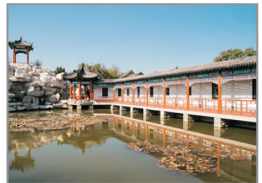
楊家埠民俗大觀園