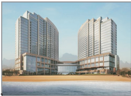
青島魯商凱悅酒店