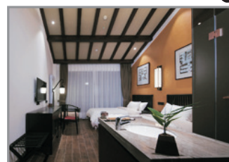
《獨家》清涼寨度假酒店