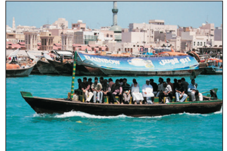
杜拜傳統水上的士ABRAS