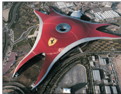
法拉利主題樂園 (包門票及暢玩指定遊戲)

遊覽2010年開幕之超級摩天大樓～哈利法塔，樓高828米，更安排乘搭電梯直達124/F全球最高的觀光層飽覽杜拜景色。樓層逾160層，95公里外仍可見。杜拜塔創下了多個世界紀錄，包括世界第一高樓、最高獨立建築、樓層層最多、最高戶外觀景台等等。