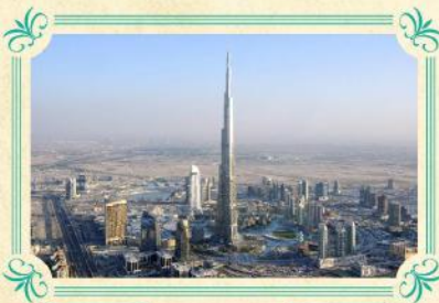
世界最高 哈利法塔Burj Khalifa

2009年中開幕，高150米，長275米，糅合了音樂和躍動水柱，變幻出1000種不同的聲光效果造型，給你震撼的視覺新享受！