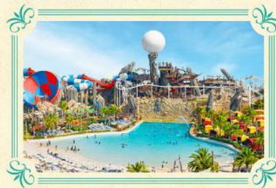
Yas沙漠水上樂園 主題公園

遊覽2010年開幕之超級摩天大樓-哈利法塔，樓高828米，更安排乘搭電梯直達124/F全球最高的觀光層飽覽杜拜景色。樓層逾160層，95公里外仍可見。杜拜塔創下了多個世界紀錄，包括世界第一高樓、最高獨立建築、樓層最多、最高戶外觀景台等等。