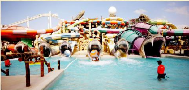
▲ Yas沙漠水上樂園主題公園

· Yas沙漠水上樂園主題公園 ：佔地近15個足球場大小的阿布達比Yas Waterworld於2013年1月24日開幕，以“消失的珍珠”為主題，讓遊客尋找傳說中的珍珠，並遊覽園內景點。樂園擁有43個特色遊樂設施，其中的世界上第一個最大的水力驅動六人旋風水道、浪高可達3米，擁有世界上最大的流水板和身體趴板可衝浪層的“泡泡筒”、“強盜轟炸機”鐳射特效水上過山車、“騎士們”特效水柱射擊等一系列多元化水上項目，更可謂絕無僅有，同時還有與之配套的餐飲、商店和互動遊戲，刺激新奇的體驗足以吸引世界目光。