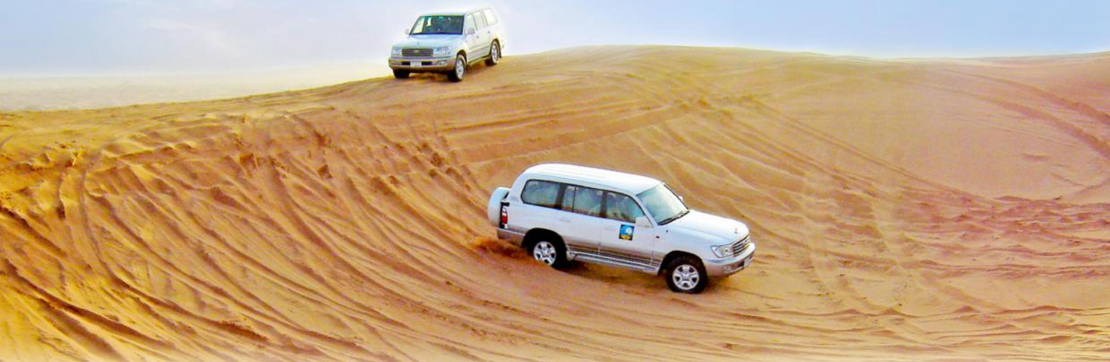
▲ 沙灘四驅車之旅(自費參加)

杜拜 (世界最高摩天大樓哈利法塔)、 阿布達比 (全球首個法拉利主題樂園、Yas沙漠水上樂園主題公園)、【阿聯酋皇宮酒店Emirates Palace】、【全球最奢華杜拜帆船酒店】6天豪華團 LMBX06X Dubai(Burj Khalifa), Abu Dhabi(Ferrari Theme Park, Yas Water World) 6 Days