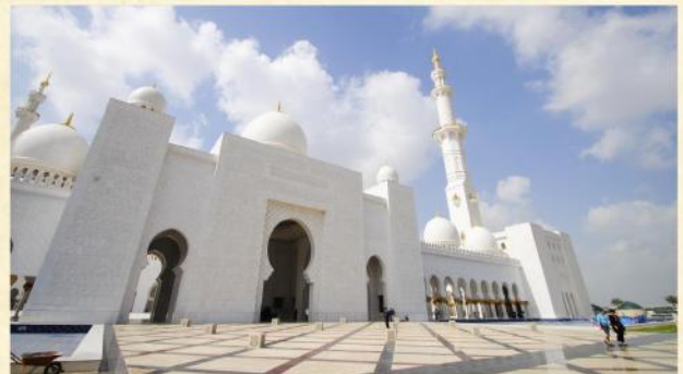
▲ 阿布達比大清真寺