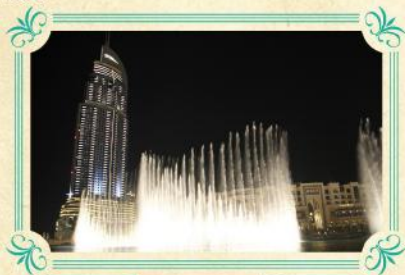
世界最大 杜拜湖音樂噴泉「Dubai Fountain」

容量1100萬公升的水族館，更可以看見魚群暢游，且有魔鬼魚及鯨鯊在潛水員身邊游過的驚險場面吸引遊客。想發掘沉睡海底數千年的亞特蘭堤斯神秘遺跡，還可以穿越大使瀉湖下如迷宮一般的海底隧道。本社安排昂貴入場門票，讓你透過玻璃通道近距離觀賞65,000隻海洋生物。