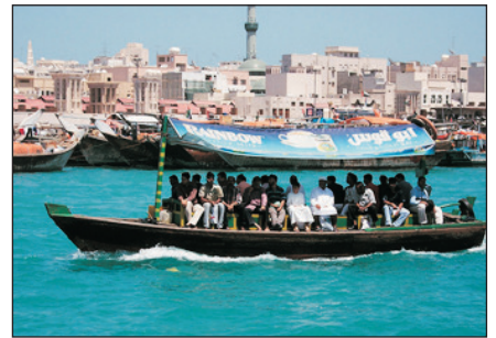
杜拜傳統水上的士ABRAS