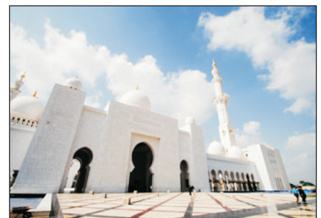
阿布拉達比大清真寺

~ Lost Chamber海底世界 ：容量1100萬公升的水族館，更可以看見魚群暢游，且有魔鬼魚及鯨鯊在潛水員身邊游過的驚險場面吸引遊客。想發掘沉睡海底數千年的亞特蘭提斯神秘遺跡，還可以穿越大使瀉湖下的迷宮一般的海底隧道。本社安排昂貴入場門票，讓你透過玻璃通道近距離觀賞65,000隻海洋生物。