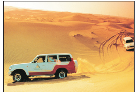
沙漠四驅車活動(自費參加)

△ 如遇上當地回教節日或慶典(如：齋戒月等)，肚皮舞表演將被取消，恕不另行通知。