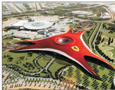
法拉利主題樂園 (包門票及暢玩指定遊戲)

前往全世界最高摩天大樓之哈利法塔Burj Khalifa參觀樓高828米，樓層逾160層，更安排乘搭電梯到達124/F全球最高的觀光層飽覽杜拜景色，天氣好時，可遠眺80公里外的美景。被譽為世界第一高樓、最高獨立建築、樓層最多、最高戶外觀景台等等。