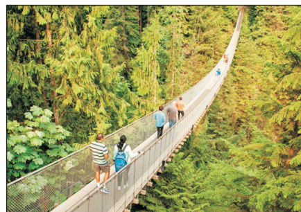
卡佩蘭奴吊橋公園