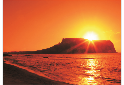
【UNESCO世界自然遺產】城山日出峰