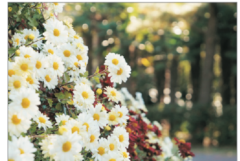
《增遊》翰林公園(賞菊花) (註1) (11月1日至16日出發團隊適用)