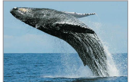
世界最大哺乳類動物(藍鯨)