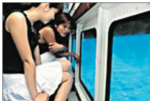
水中潛望觀光船 Marine Star

建於1975年舉辦沖繩國際海洋博覽會的舊址上，佔地70萬平方米。寬闊的園內可使用電動巴士代步，主要景區有精彩有趣的『海豚劇場(包入場)』、飼養了二百多種魚類的『美麗海水族館』(重本包入場)、『海洋文化館』(可自行購票入場約¥170)、『熱帶夢幻中心』、『植物園』等(部份展覽館須自行購票入場)。有興趣可走到景觀優美的「綠寶石海灘」拍照留念。